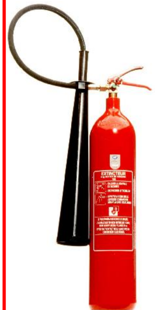
Extincteur CO 2 5 KG