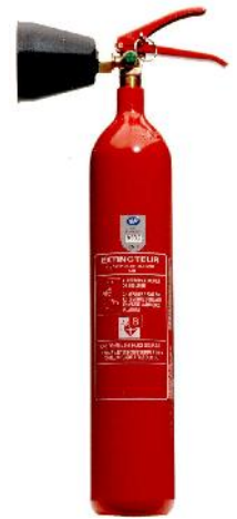
Extincteur CO 2 2 kg