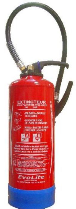
Extincteur Eau Water Extinguisher