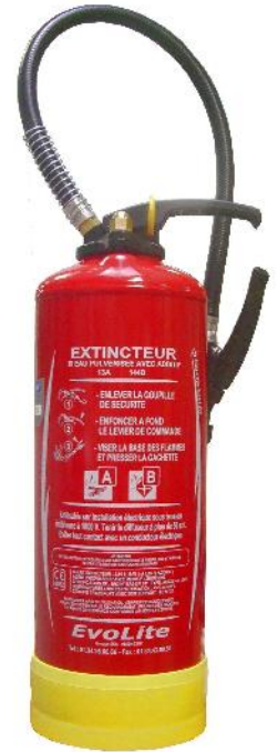
Extincteur Poudre Powder Extinguisher