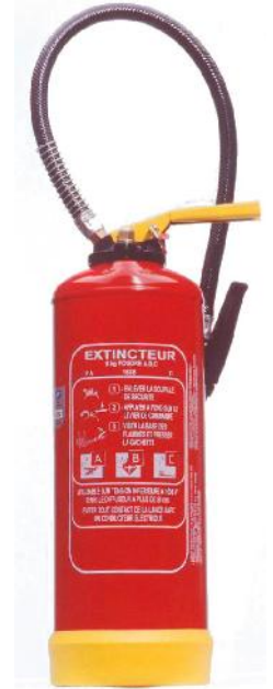
Extincteur Poudre Powder Extinguisher