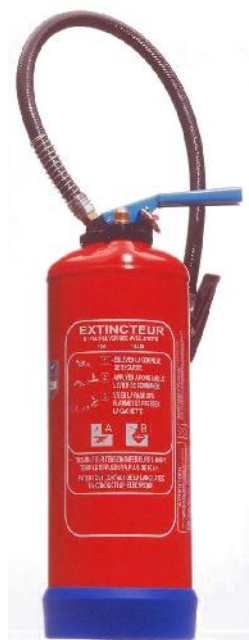
Extincteur Eau Water Extinguisher