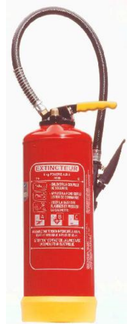
Extincteur Poudre Powder Extinguisher