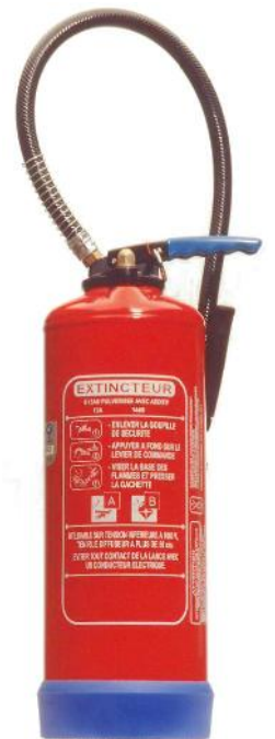
Extincteur Eau Water Extinguisher