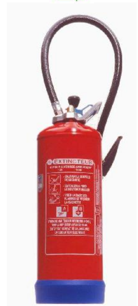
Extincteur Eau Water Extinguisher