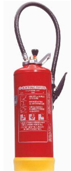
Extincteur Poudre Powder Extinguisher