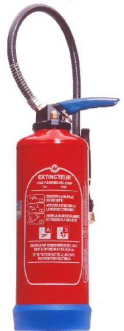
Vulcain Eau Water Extinguisher