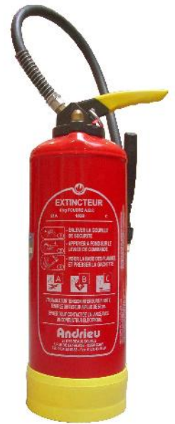
Vulcain Poudre Powder Extinguisher