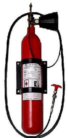
Extincteur 2 Kg