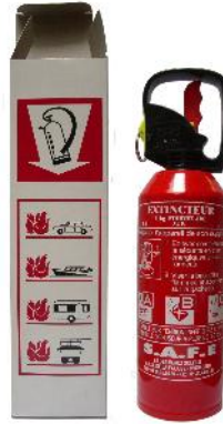
1 KG DELTA ABC