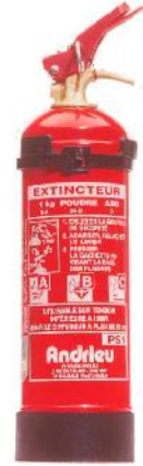
1 KG PS1 ABC